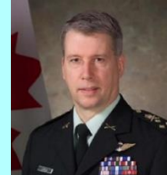
le Lgén (à la retraite) Andrew Leslie