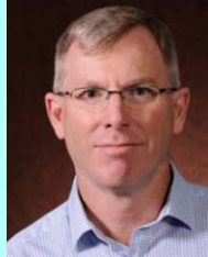
le Lgén (à la retraite) Stu Beare