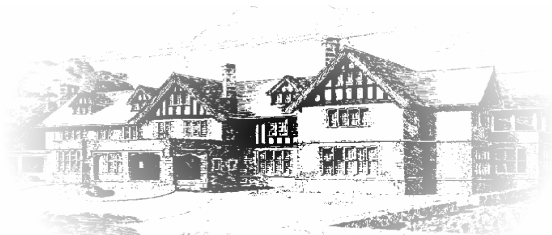
Mess des officiers d'Armour Heights