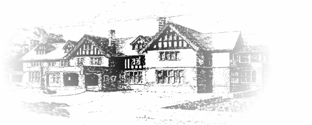
Armour Heights Officers' Mess